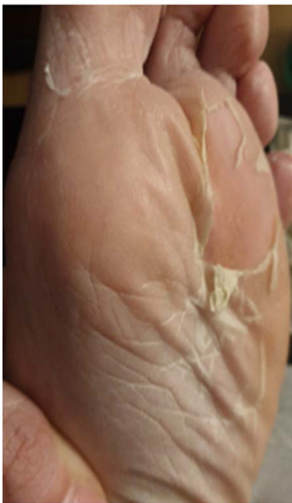
Figure 1 Desquamations des plantes des pieds au cours de la phase prolongée de COVID-19.

L'imprévisibilité de la survenue des symptômes, la gêne provoquée par ces troubles et l'absence de réponses diagnostiques satisfaisantes quant à leur étiologie génèrent troubles anxieux et états dépressifs chez les patients qu'il faut savoir repérer et prendre en charge.